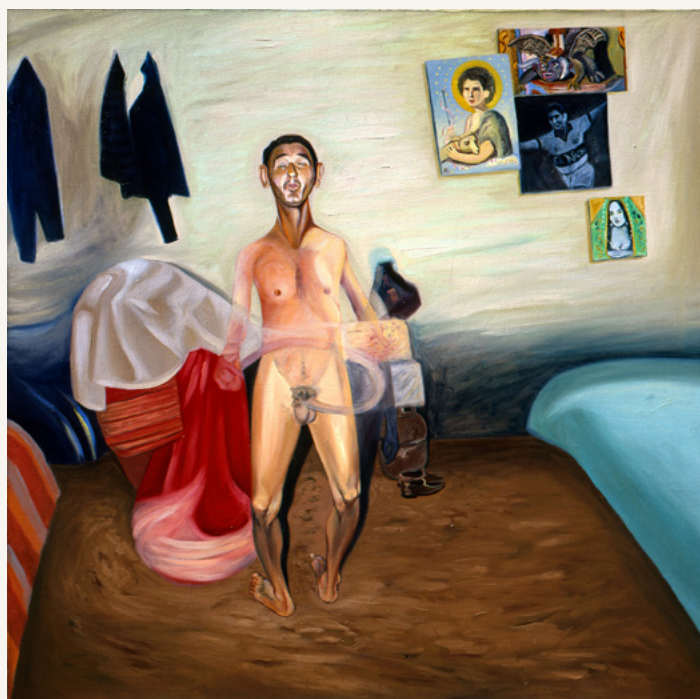
Kurupí en su habitación, II 1994 Óleo sobre tela 80 x 80 cm Colección privada, Paraguay