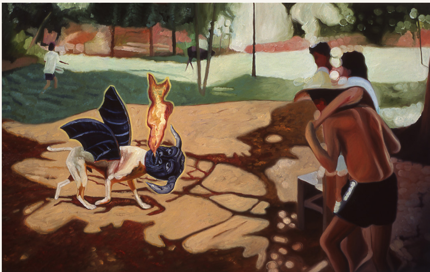
Añá después de la caña (el Diablo)