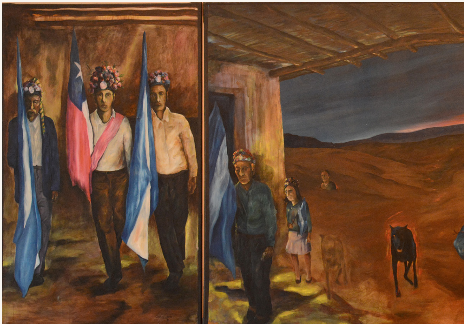
Los chinos de la Virgen de Andacollo (tríptico)