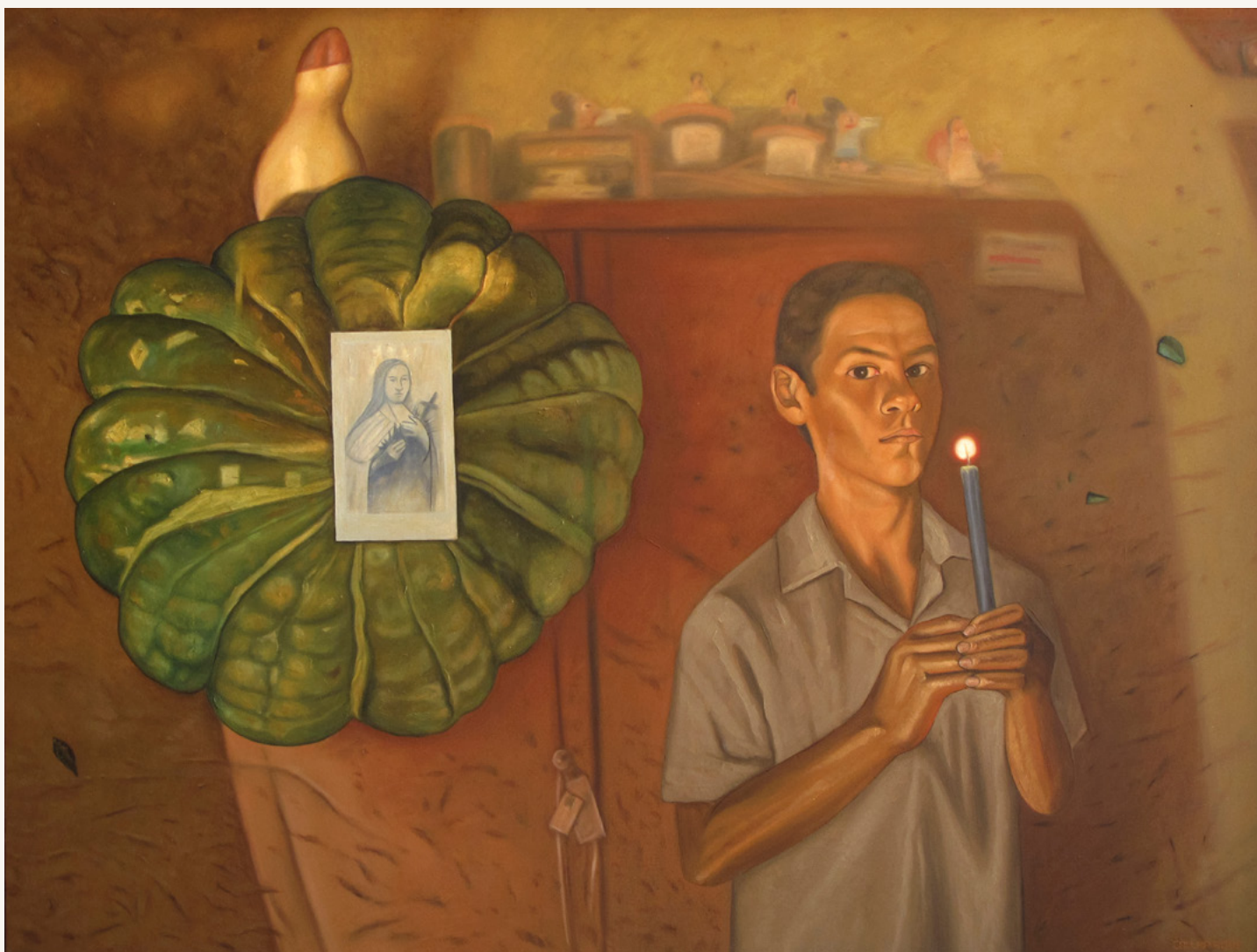
Tataindy 2003 Óleo sobre tela 75 x 100 cm Colección privada, Paraguay