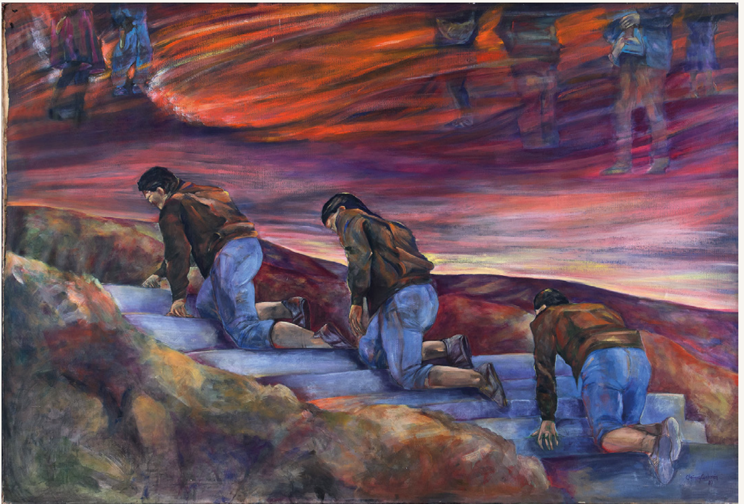
Viernes Santo 1989 Acrílico sobre tela 164 x 240 cm Colección del artista