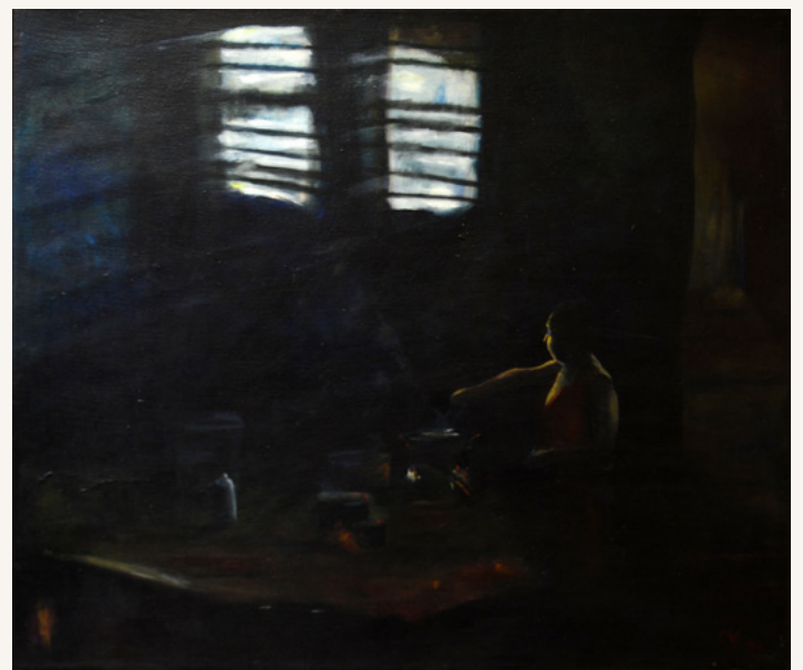
Torta de trilla 1994 Óleo sobre tela 60 x 70 cm