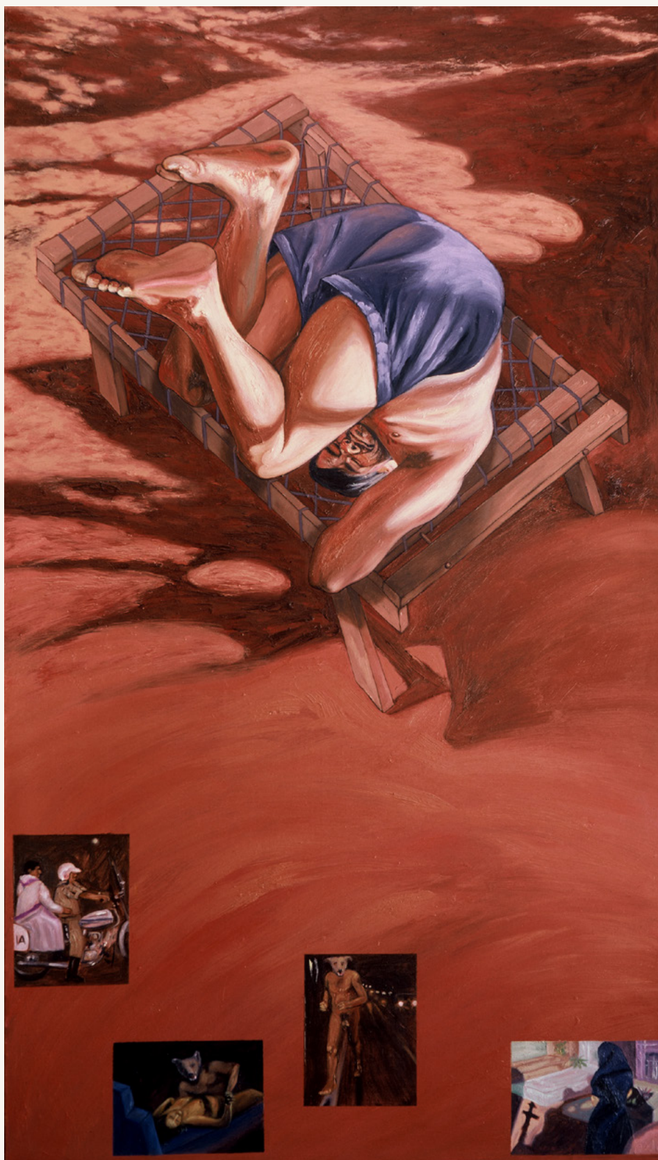
Siete vueltas sobre las cenizas (políptico sobre la historia de un séptimo hijo varón) 1996 Óleo sobre tela 145 x 200 cm Colección del artista