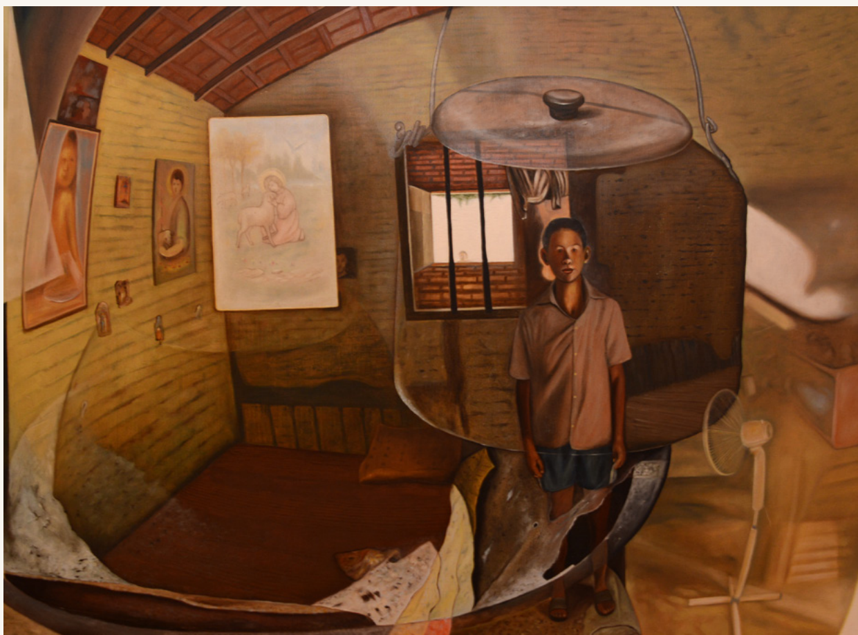
Tanimbu 2002 Óleo sobre tela 72 x 100 cm Colección privada, Paraguay